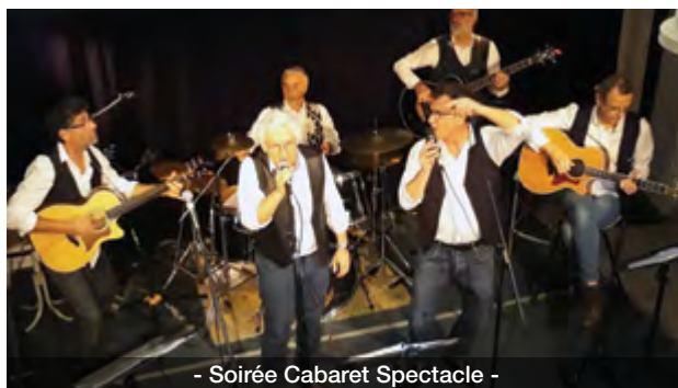
- Soirée Cabaret Spectacle -

Cette petite formation composée de divers talents est bien décidée à explorer le répertoire folk des années 60-80 à travers un hommage aux icônes de la contre-culture : « Simon et Garfunkel ».