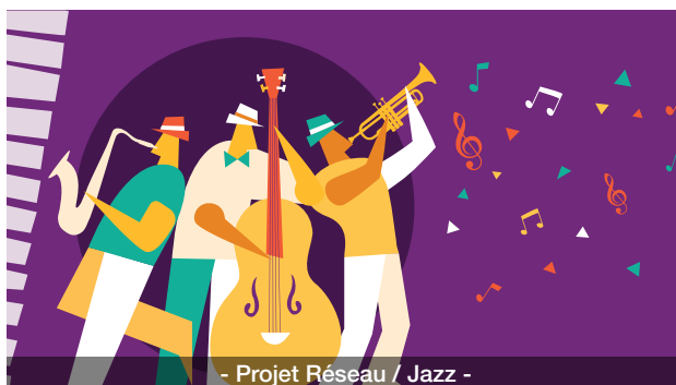
- Projet Réseau / Jazz -