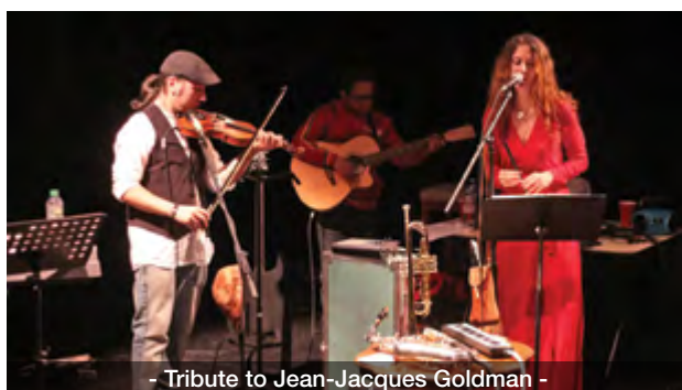
- Tribute to Jean-Jacques Goldman -

Jean-Jacques Goldman ne chante plus ? D'autres se chargent de le faire pour lui, avec leur propre répertoire. Le groupe grenoblois « FAMILLE » présente un spectacle autour de son « artiste français préféré ».