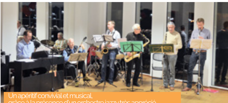
Un apéritif convivial et musical, grâce à la présence d'un orchestre jazzy très apprécié.