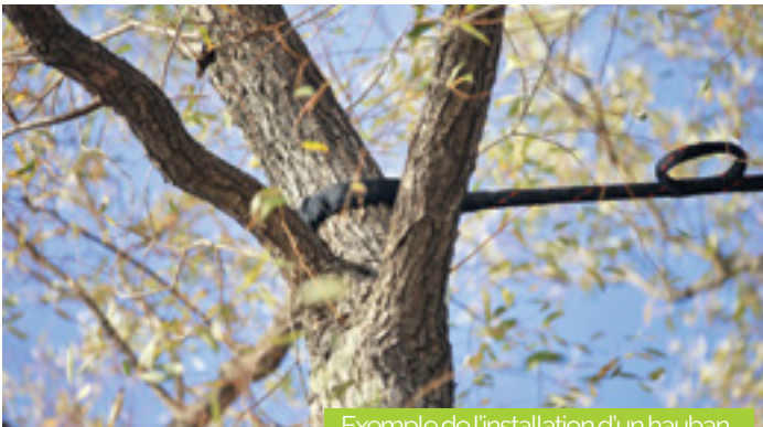
Exemple de l'installation d'un hauban.

L'installation de ce dispositif aura lieu en février. Quant aux pièges à phéromones et niochirs à mésanges bleues habituellement installés pour préserver les arbres de la mineuse, un parasite néfaste, ils retrouveront leur place et leur rôle au service de la bonne santé et de la préservation des trois marronniers.