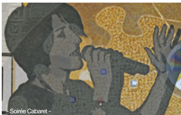
- Soirée Cabaret -

Qu'on les aime pour leurs textes ou pour leurs mélodies, ou les deux à la fois, les chansons françaises sont de petits espaces dans lesquels chacun aime à se lover, à se couler dans la chaleur des émotions joyeuses ou nostalgiques qu'elles font émerger en nous, inmanquablement.