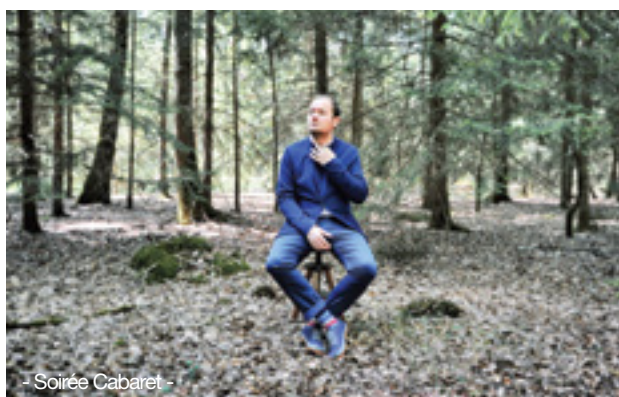
- Soirée Cabaret -

Ce soir, il replonge dans ce répertoire grand public et dans ses souvenirs personnels en même temps. En plus, pour y poser un nouveau regard, il s'interdit de toucher à la guitare pour l'explorer au piano.