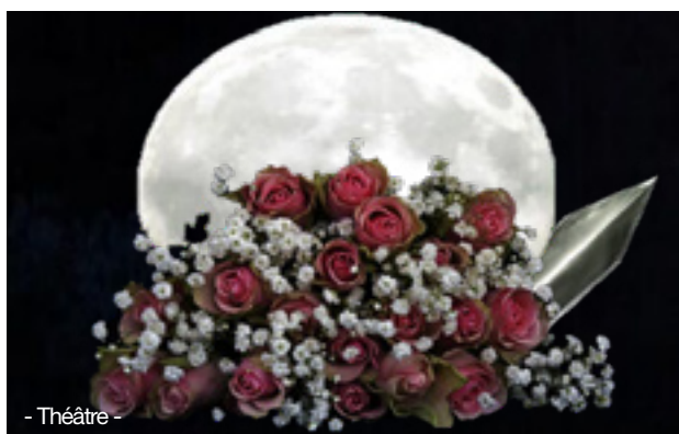
- Théâtre -

L'histoire empreinte de sensualité, de violence et d'onirisme plonge le spectateur dans une tragédie intemporelle et bouleversante... Mise en scène : Elodie DAVID