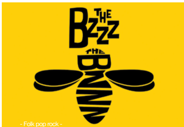
- Folk pop rock -