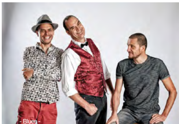
- Blues -