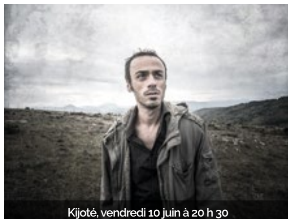
Kijoté, vendredi 10 juin à 20 h 30

L'ATRIUM, c'est aussi une Galerie d'art qui accueille régulièrement des expositions, offrant aux artistes des espaces de créativité pour toutes les sensibilités . Cette saison, découvrez les photographies de l' Atelier Photo 360 autour du thème « 4 images pour 1 lieu ». Puis partez à la rencontre de Christian Vogel , artiste peintre aux inspirations multiples, amoureux des paysages et de la musique.