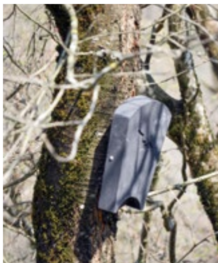
Au cimetière du Fontanil-Cornillon.

Les échanges sont en cours avec le groupe scolaire pour un travail pédagogique autour du petit mammifère.