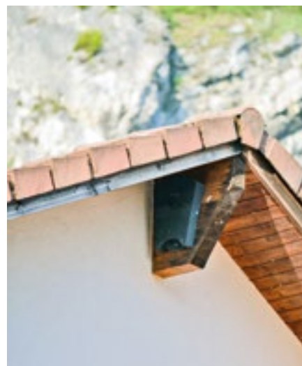
Sous les toits de l'école maternelle.