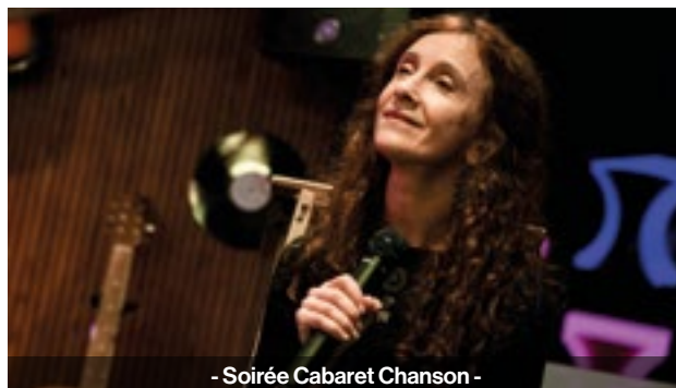
- Soirée Cabaret Chanson -