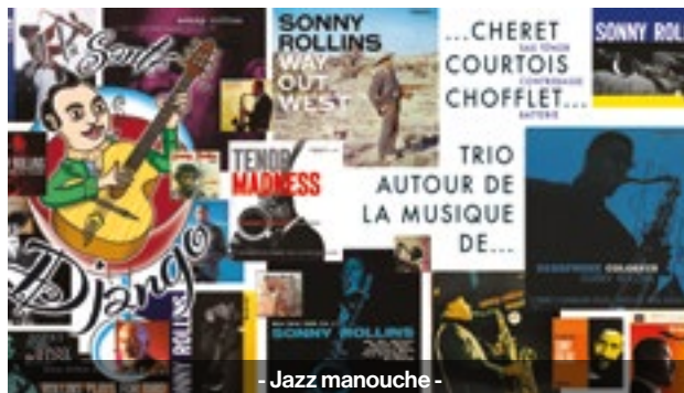
- Jazz manouche -

Pour une fois, éloignons-nous de la musique de Django pour ouvrir notre programmation à un jazz bien différent mais tout aussi passionnant. Place à la musique de Sonny Rollins , l'un des plus fameux saxophonistes de l'histoire du jazz ! Michaël Cheret nous présente l'une des facettes du Géant américain : sa musique en trio avec contrebasse et batterie, qui par sa structure même laisse une très grande liberté de création au leader, le libérant de certaines contraintes.