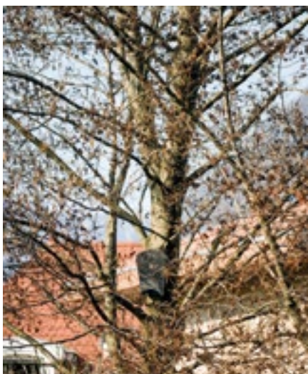
Sur le secteur de Chancelière.