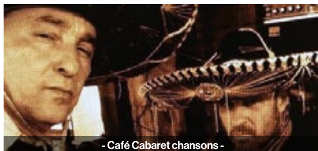
- Café Cabaret chansons -

Ils jouent des tubes emblématiques des années 60, 70, 80, 90, de Ray Charles en passant par Nina Simone, Les Temptations et les Door's, reprennent Bob Marley en version Jazz et atterrissent en nous présentant en exclusivité leurs propres compos teintées de Soul, de Bossa nova et de techno électro avec leur fameux tube Verbalize, hymne à la non-violence et néanmoins hyper dansant.