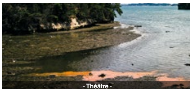
- Théâtre -

Une station balnéaire est touchée une nuit par une hécatombe de poissons. Les habitants du port réagissent de manière différente à ce phénomène étrange : les pêcheurs, le maire, le shérif, des sirènes dépravées.... Même les animaux du lieu semblent touchés.