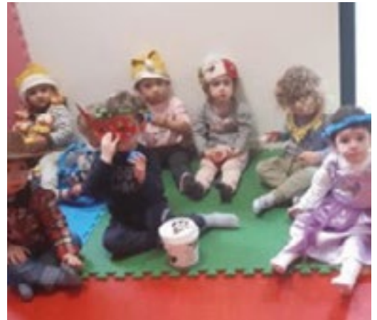
Enfants et assistantes maternelles étaient déguisés pour fêter Carnaval jeudi 23 février.

Des permanences sont proposées à l'Univers des tout-petits (espace multi-accueil du Fontanil-Cornillon) le mercredi de 13 h 30 à 17 h. D'autres créneaux horaires sont possibles sur rendez-vous.