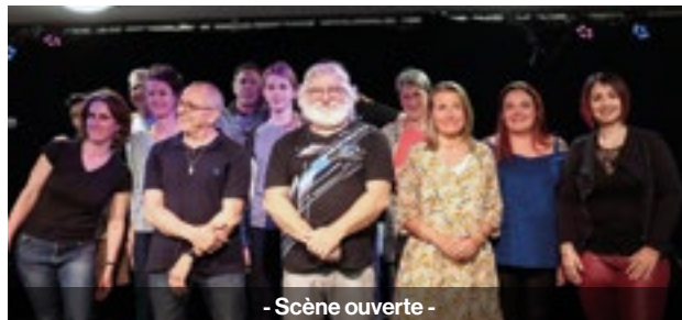
- Scène ouverte -

Inscriptions par mail uniquement : claud.beaupin@laposte.net