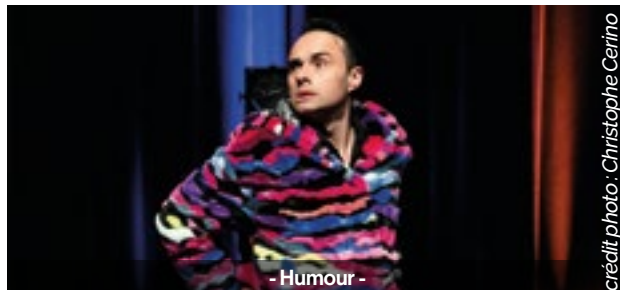
- Humour -

C'est pourquoi il se propose d'être le porte-drapeau coloré de la classe moyenne ! Il teste d'ailleurs avec un succès relatif quelques moyens pour passer à la classe supérieure !