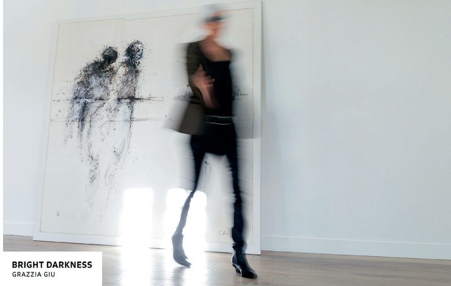
BRIGHT DARKNESS GRAZZIA GIU